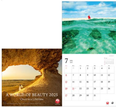
A WORLD OF BEAUTY(普通判)/表紙/7月